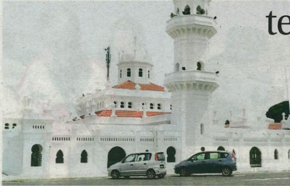
Masjid Sultan Alaeddin