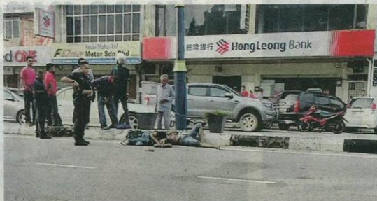
Dua suspek berjaya ditangkap dihadapan sebuah bank.