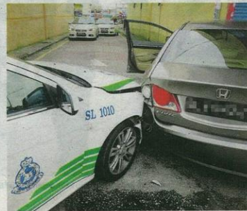
Kereta peronda polis berjaya menghimpit dan memintas kereta suspek.

serempak dengan pasukan peronda Ibu Pejabat Polis Daerah (IPD) Kuala Langat.